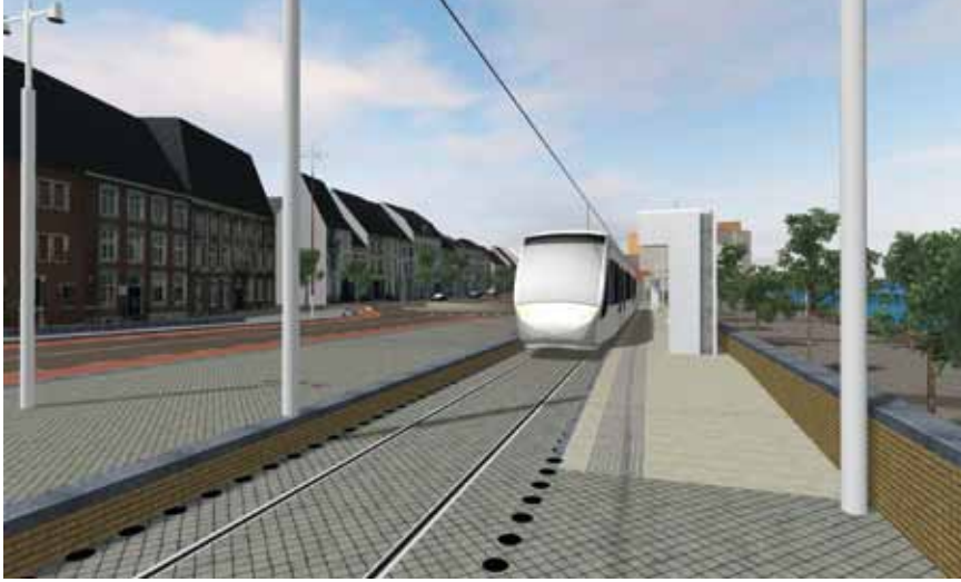
Animatie van de halte Maasboulevard, kijkend in noordelijke richting.

zondag 5 - dinsdag 7 juni, Porte de Versailles in Parijs tentoonstelling over duurzame mobiliteit t 0033 148740482 e salon@objectiftransportpublic.com i www.transportspublics-expo.com